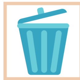
zorgen voor het milieu, wij sorteren