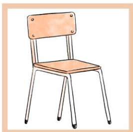
De stoelen goed zetten