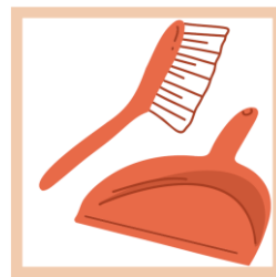
Helpen met vegen