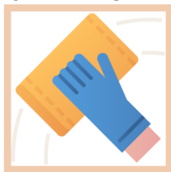
De tafels poetsen