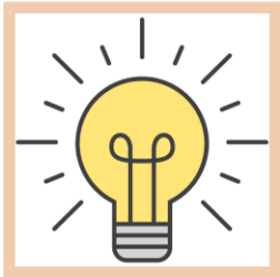
De lichten aan/uit

De kleuters hebben ook elke week een vast taakje, deze worden uitgedeeld op maandag. De taakjes zijn de volgende :